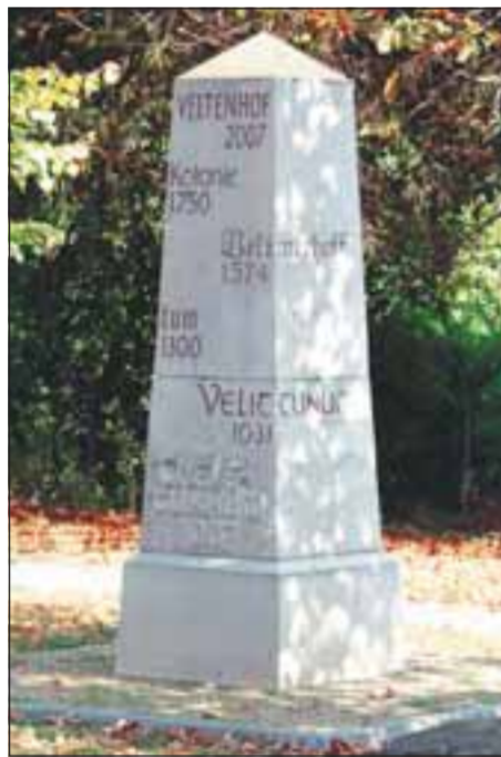
Zum 1000-jährigen Jubiläum 2007 wurde vor den Siedlerhäusern ein Obelisk mit der Ortsgeschichte aufgestellt.

Bis zur Wiederbegegnung der Wieblingener mit den alten Vorfahren dauerte es allerdings noch viele weitere Jahre: Erst 1967 stieß ein Heidelberger Journalist bei einer Reise nach Hamburg in Braunschweig auf die heimatischen Straßennamen. Er fragte sich durch, schrieb einen Bericht und legte damit schließlich den Grundstein für die freundschaftlichen Verbindungen zwischen Wieblingen und