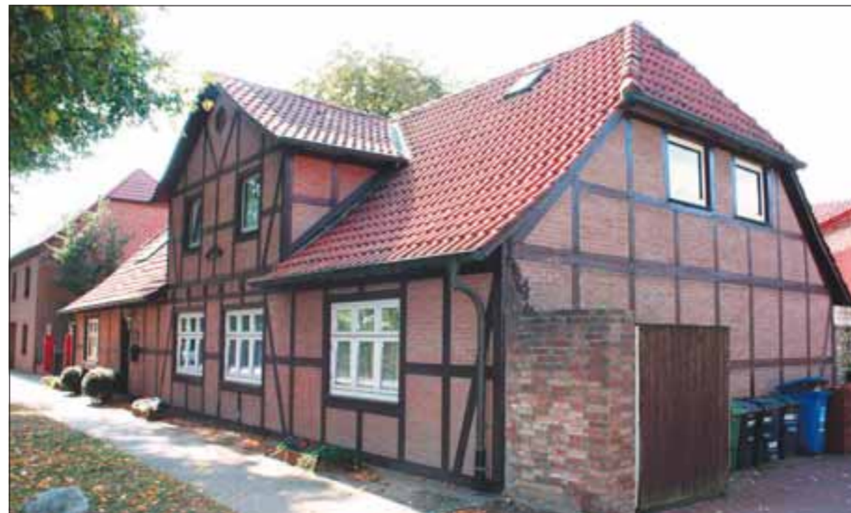
Die acht Kolonistenhöfe stehen bis heute in Veltenhof, dieses Haus wurde 1754 fertiggestellt. Die Gebäude stehen etwazurückgesetzt, zwischen der Straße und den Häusern befindet sich ein Grünstreifen mit sehr alten Linden. Hier wohnten damals 15 Familien mit insgesamt 50 Personen.