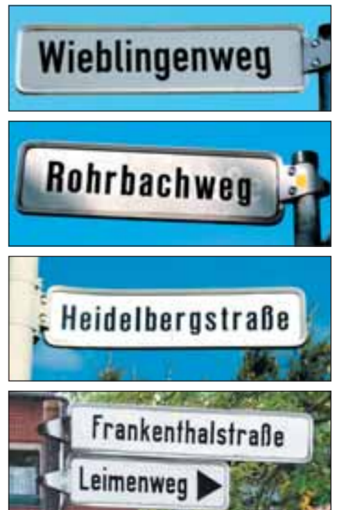
Vieles erinnert in Veltenhof noch an die Kurpfälzer Heimat: Auch die Straßenschilder, rund um die Pfälzer Straße.