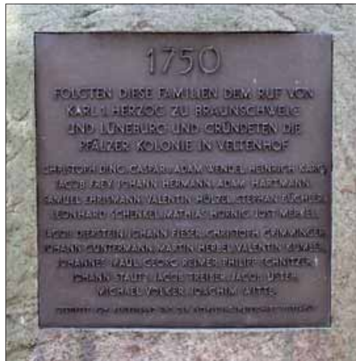
Alle Namen der Einwanderer von 1750 sind auf einer in einem Findling eingelassenen Bronzetafel des Realverbands und der Interessengemeinschaft Veltenhof aufgelistet.

Und auch das Wappen des Braunschweiger Ortsteils erinnert an die alte Heimat: Der Pfälzer Löwe hält seit fast 30 Jahren die Veltenhofer Mühlenkirche in den Pranken. Womit man gleich bei der nächsten Besonderheit ist: Nicht nur, dass der Kirchraum in einer alten Mühle von 1876 untergebracht ist, die Gemeinde ist im evangelisch-lutherischen Niedersachsen ein Exot: Sie ist die einzige calvinistische Gemeinde in der Stadt. Und hält seit 1930 ihre Gottesdienste in der Mühle ab.